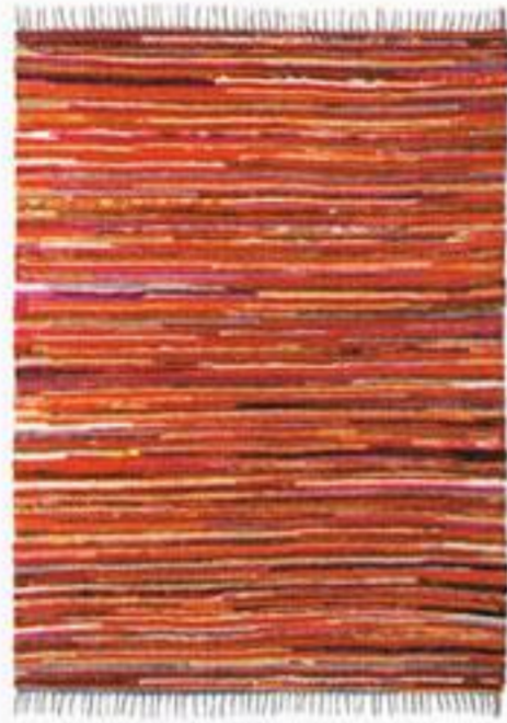
Tapete, € 129,00, Area.