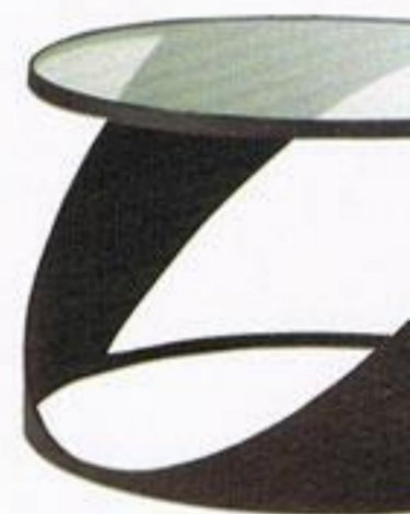
Mesa de apoio, € 79,99, Roche Bobois.