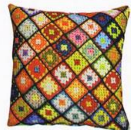
Capa de almofada, € 12,95, A Loja do Gato Preto.