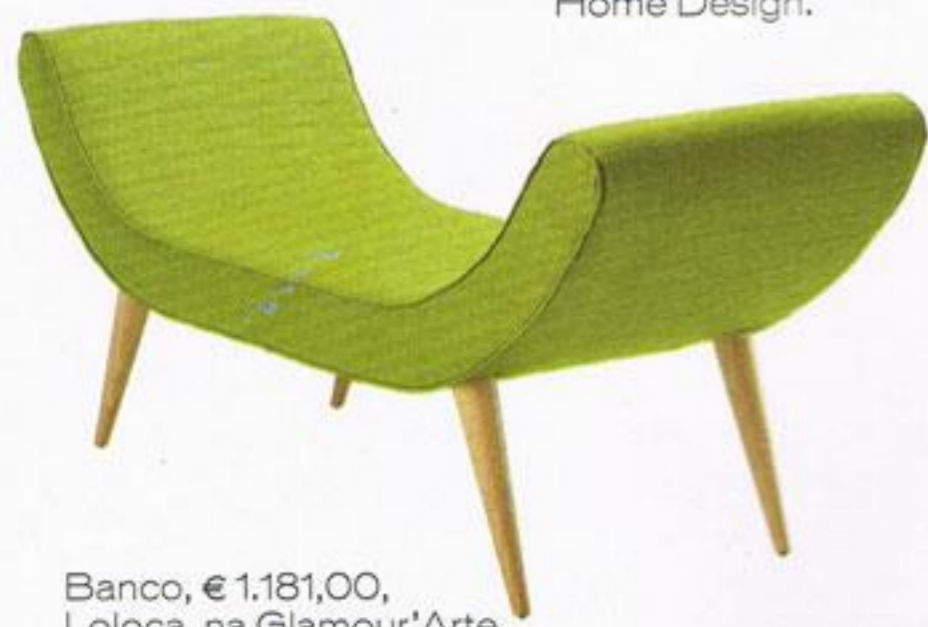
Banco, € 1.181,00, Loloca, na Glamour'Arte.