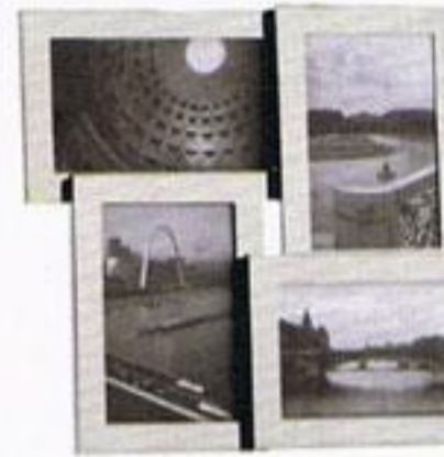
Moldura, € 24,99