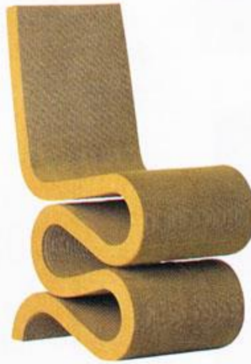
Cadeira, € 789,00, Vitra, na Catarino Home Design.