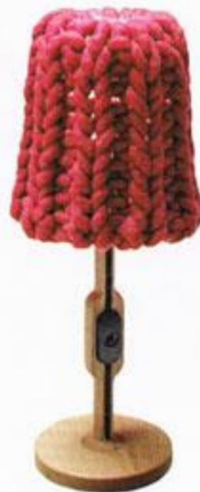
Candeeiro de mesa, € 608,85, Casamania na A Linha da Vizinha.