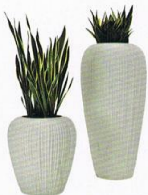
Vaso baixo, € 268,00, Vaso alto, € 395,00, Mandrágora.