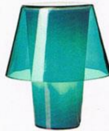
Candeeiro de mesa, € 9,99, Ikea.