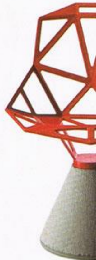
Cadeira, € 436,00, na Catarino Home Design.