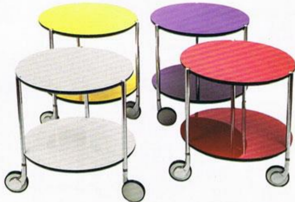
Mesa de apoio, cada, € 49,95, A Loja do Gato Preto.