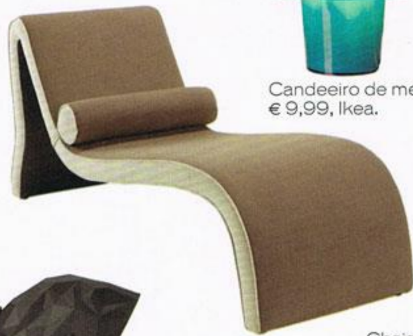
Chaise longue, € 1487,00, Loloca, na Glamour'Arte.