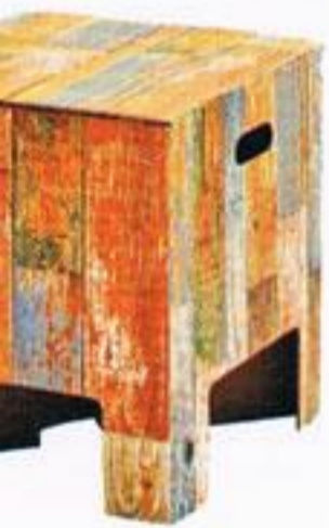
Stool, € 28,00, Dutch, na Glamour'Arte.