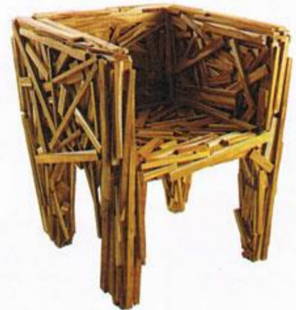
Cadeira, € 4.612,50, Edra, na Tralhão.