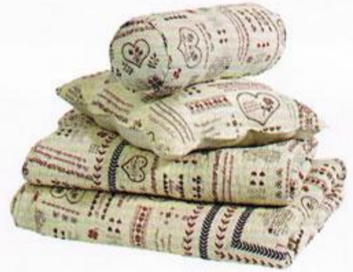
Almofada, de € 6,99 a € 9,99 e Quilt, de € 39,95 a € 59,95, Casa.