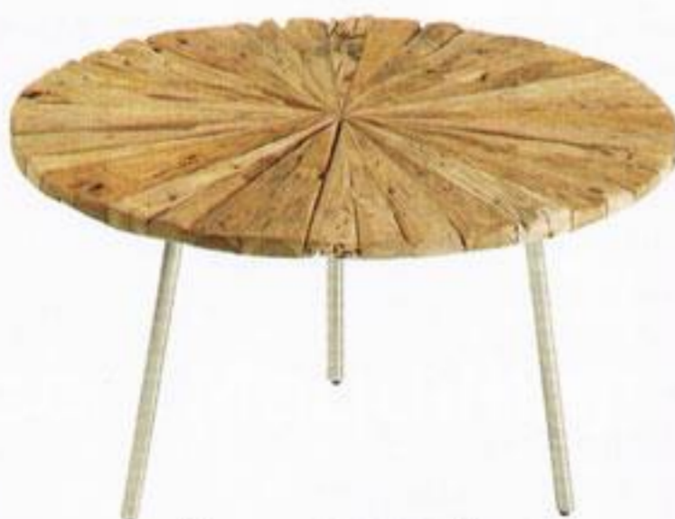
Mesa, € 350,00, Mandrágora.