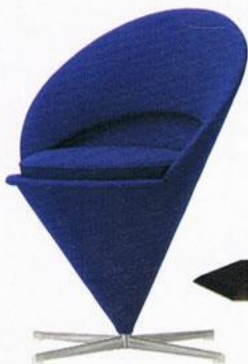
Poltrona, € 2.040,00, Vitra, na Catarino Home Design.