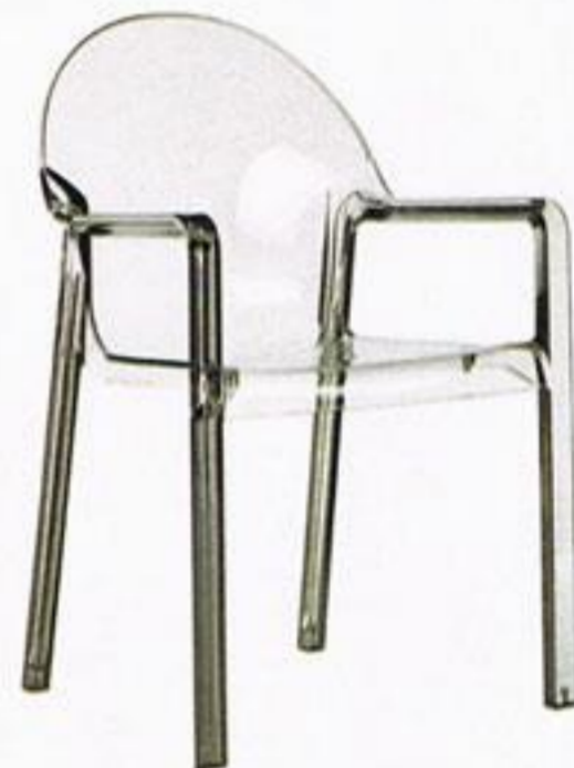
Cadeira, € 228,80, Magis, na Tralhão.