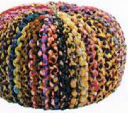
Pouf, € 130,00, Mandrágora.

Não é um estilo apenas usado nas tradicionais casas de campo. Hoje, as peças com aspecto campestre adaptam-se perfeitamente a qualquer casa citadina e criam ambientes acolhedores e cosy. Os tons terra e os cremes são essenciais na paleta de cores desta tendência. A madeira é o material chave.