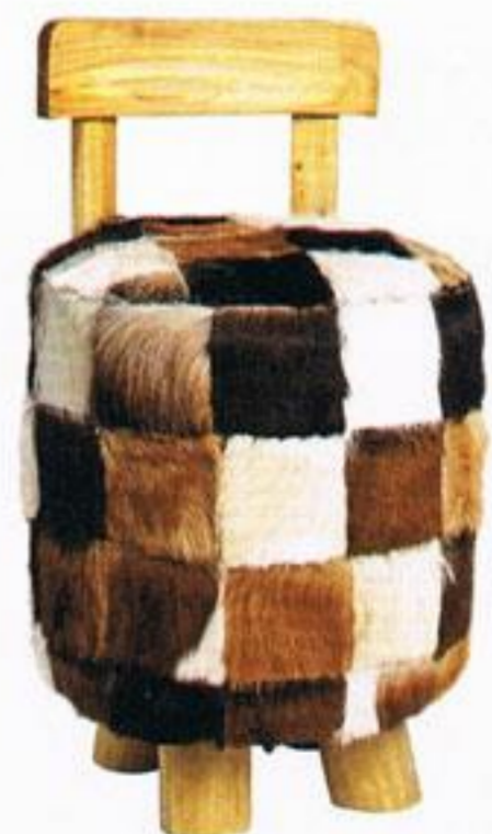
Banco, € 99,99, Zara Home.