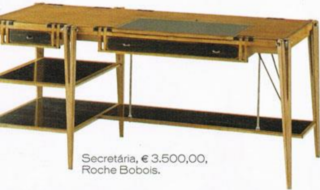
Secretária, € 3.500,00, Roche Bobois.