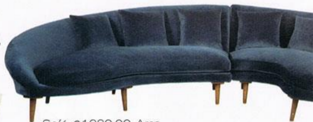
Sofá, € 1.980,00, Area.