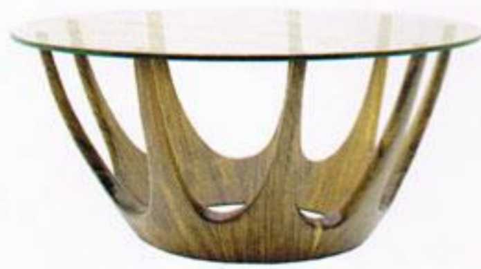
Mesa, € 1.800,00, Mandrágora.