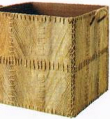
Cesto, € 14,99, Ikea.