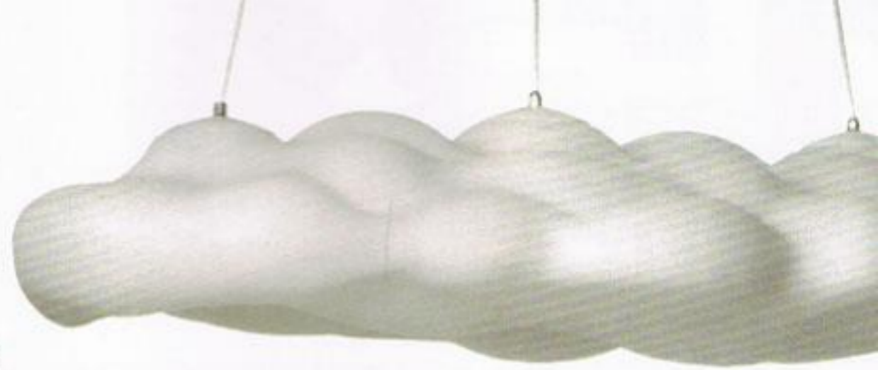
Candeeiro de suspensão