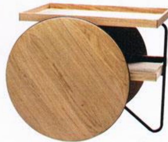
Chariot, € 1.587,93, Casamania na A Linha da Vizinha.