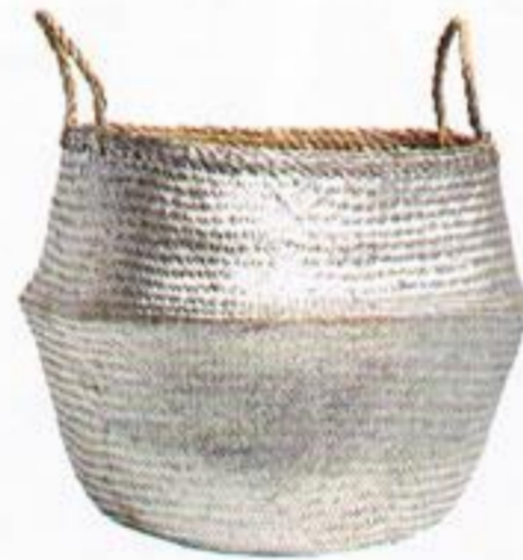
Cesto, € 29,99, Zara Home.