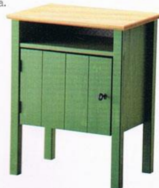
Mesa-de-cabeceira, € 79,99, Ikea.