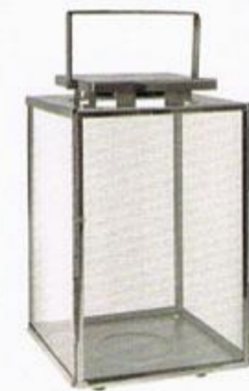
Lanterna, € 39,99, Zara Home.