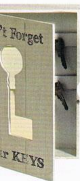
Cabideiro, € 9,99, Casa.