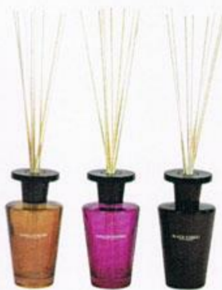
Óleo perfumado, cada, € 39,95, Casa.